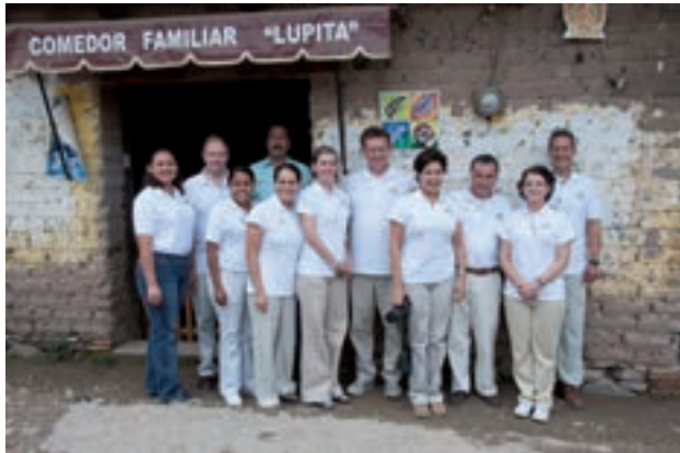
Figura 11. El equipo de Dermatología comunitaria listo para entrar en acción.