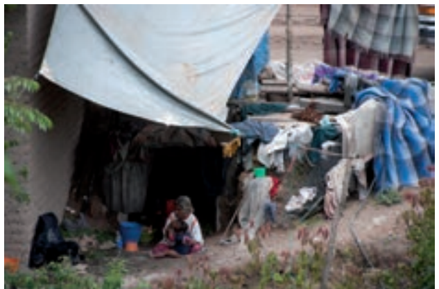
Figura 15. "Caricias de una abuela, para sobrellevar la pobreza material".