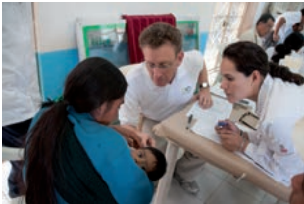
Figura 8. Revisión minuciosa de cada caso.