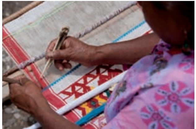
Figura 14. "Manos que tejen sueños".