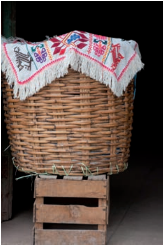
Figura 16. "Servilletas de colores, como las flores del campo".