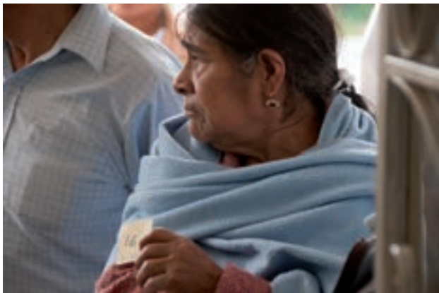
Figura 3. Esperando el turno de consulta.