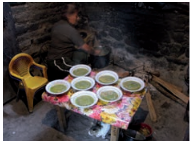
Figura 20. "Compartirás la austeridad de mi comida y sabrás que no hay mejor condimento que el hambre".