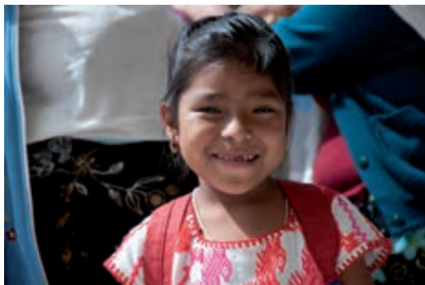
Figura 13. "Te regalaré la sonrisa de mis niños y la dulzura de su mirada".