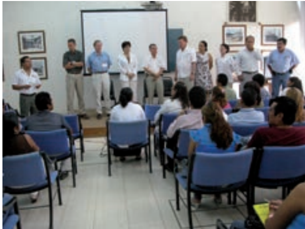
Figura 2. Profesores invitados al curso de Dermatología comunitaria.