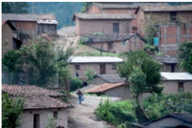
Figura 12. Caserío del pueblo.