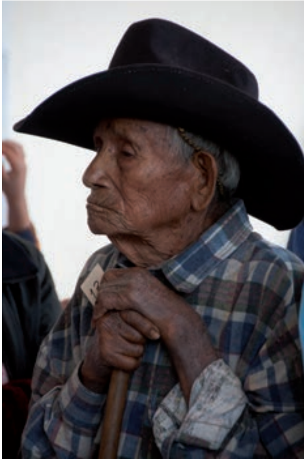
Figura 7. "Tiempo que roba los años pero no la dignidad".