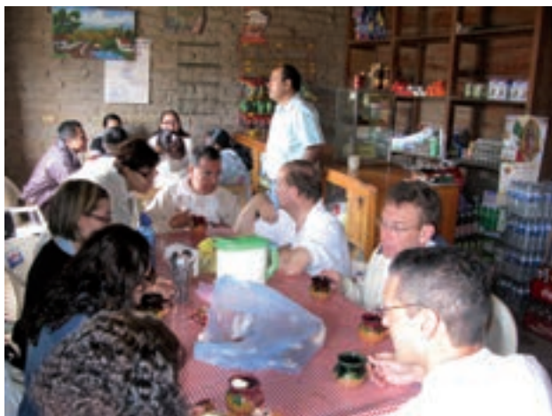
Figura 17. "Qué une más, que compartir la comida y el trabajo".