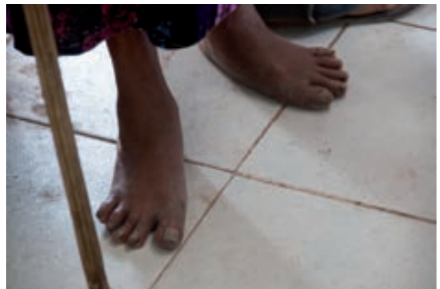
Figura 19. "Cansados por el peso de los años y gastados por la pobreza".