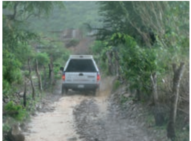
Figura 18. "Con lluvia o con sol, por caminos y veredas".