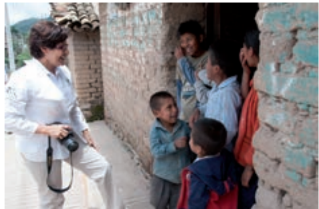
Figura 6. Una buena comunicación indispensable para nuestra labor.