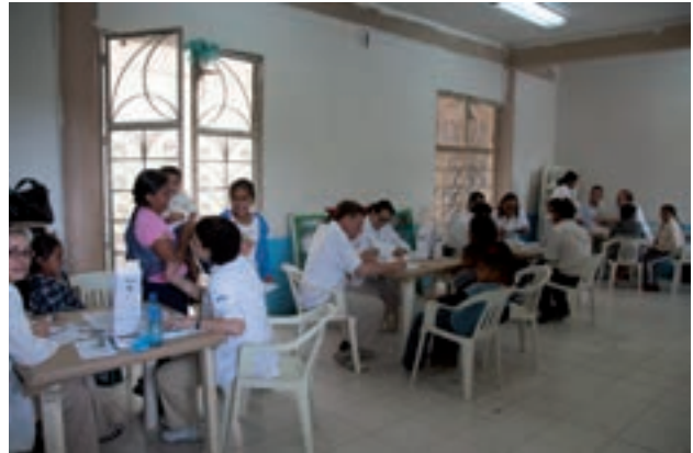
Figura 5. Consulta simultánea en consultorios adaptados.