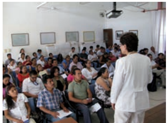
Figura 1. Curso de Dermatología comunitaria al personal de salud de Tlapa.