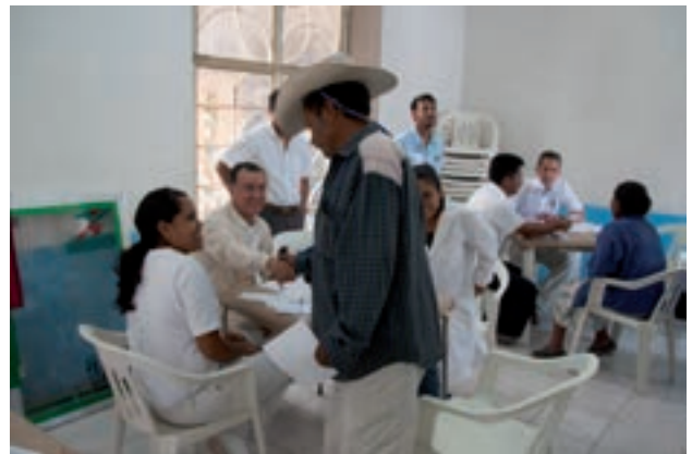
Figura 10. Un apretón de manos y un gracias sincero, el mejor pago.